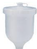
ΚΑΔΟΣ ΓΙΑ W400