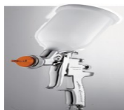
AZ3 HTE-S IMPACT 1.3HD ΑΡΙΣΤΟ ΠΙΣΤΟΛΙ ΓΙΑ ΧΡΩΜΑ &ΒΕΡΝΙΚΙ