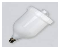
ΚΑΔΟΣ ΓΙΑ SUPER NOVA