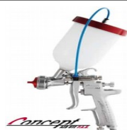
AZ3 HTE P.A.S CONCEPT 2.0 HD ΠΙΣΤΟΛΙ ΥΠΟΠΙΕΣΗΣ ΓΙΑ ΠΑΧΥΡΕΥΣΤΑ ΠΡΟΙΟΝΤΑ ΖΕΛΕ , GEL COAT ΕΠΙΠΛΟΠΟΙΟΙΑΣ