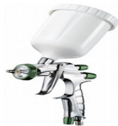
LS-400 EVOTECH/BASE SUPER NOVA EVO ΓΙΑ ΧΡΩΜΑ 1.5 HTS