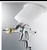
W400-WBX 1.3HD ΑΡΙΣΤΟ ΠΙΣΤΟΛΙ ΓΙΑ ΧΡΩΜΑ & ΒΕΡΝΙΚΙ