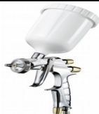
WS-400-EVOTECH/CLEAR SUPER NOVA EVO ΓΙΑ ΒΕΡΝΙΚΙ 1.3 HD